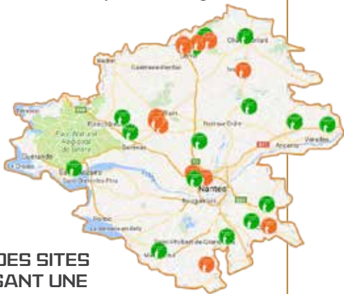
CARTE DES SITES PROPOSANT UNE OUVERTURE TRUITE EN 2018