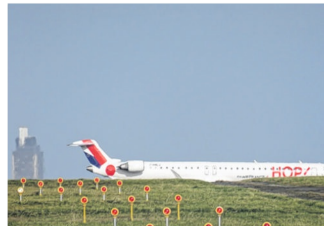
Les liaisons de Nantes vers la Corse seront renforcées cet été.

Par ailleurs, à l'été 2018, HOP ! Air France va offrir 850 000 sièges sur son réseau domestique (hors Paris) en renforçant l'offre vers Paris au